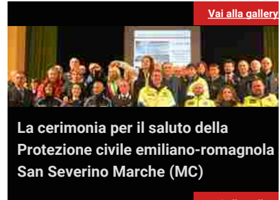
La cerimonia per il saluto della Protezione civile emiliano-romagnola San Severino Marche (MC)