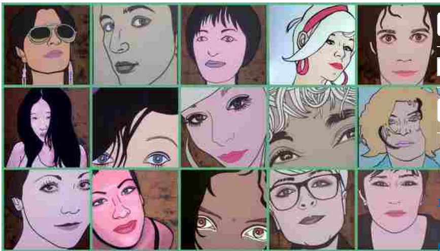
Collage delle 12 opere di Permaria Romani